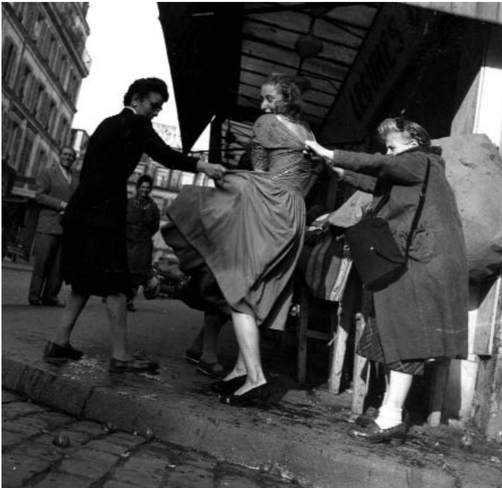
Fig. 10. Repercusión del New Look : dos mujeres tiran y rompen el vestido de otra señora, en el barrio de Montmartre (París), por considerar una provocación llevar semejante cantidad de tejido en época de restricciones.

Sin embargo, la conmoción que la línea Corolle provocó en el mundo de la moda internacional tuvo su apasionado parangón en el efecto que, sobre una población empobrecida y traumatizada por la reciente contienda, produjo el espectáculo de un estilo que sobrevolaba las miserias inmediatas y anunciaba un tiempo de bonanza y bienestar. Pero para ello aún habría de transcurrir un tiempo difícil, que para Christian Dior fue el de su consagración universal. En sólo diez años y 22 colecciones, el nombre de Christian Dior y el de su casa de costura se convirtieron en leyenda.