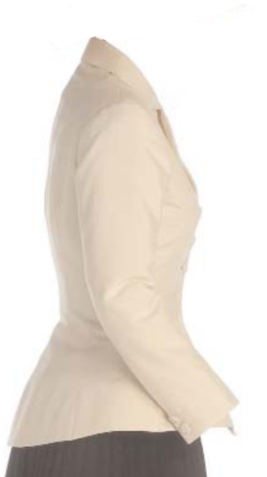
Fig. 1. Detalle del Traje Bar de Christian Dior. MT101048. Museo del Traje. C.I.P.E.

El traje que tenemos ante nuestros ojos, el Traje Bar , es seguramente el más famoso de la historia de la moda, el más icónico. Y lo es por diversas circunstancias coincidentes que lo convirtieron en símbolo de una ruptura en la evolución de la manera de vestir. Pero, además, el Traje Bar fue en su época un escándalo, y su fotografía dio la vuelta al mundo como expresión de indignación ante la osadía que un desconocido diseñador, llamado Christian Dior, había cometido, sin tener en cuenta las penurias económicas que atravesaban sus conciudadanos y las restricciones de tejido que imperaban en la Francia de posguerra.