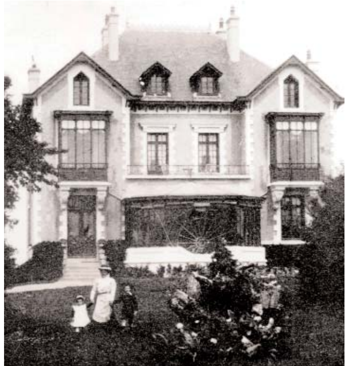
Fig. 3. La casa de la familia Dior en Granville (Normandía).

Para su mente infantil, la llegada a París, en 1910, fue una fiesta que se prolongó durante mucho tiempo. Pasó su juventud como un diletante. Disfrutó de un París creativo, cosmopolita, lleno de novedades, y recorriéndolo se cultivó en el arte de vivir. Se matriculó en Ciencias Políticas para contentar a sus padres, y cumplió el servicio militar, pero siempre alimentó con perseverante insistencia su pasión por la creatividad, favorecida por un círculo de amistades entre las que se encontraban Jean Cocteau, Max Jacob, Christian Bérard o Salvador Dalí. Ese círculo fue