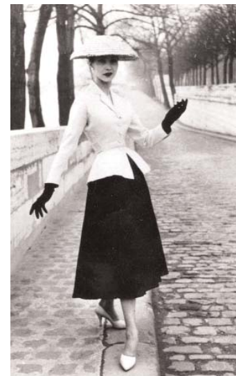
Fig. 6. El célebre Traje Bar. Esta imagen del fotógrafo Willy Maywald dio la vuelta al mundo.

El New Look de Dior recuperaba una silueta con cintura de avispa, busto alto y prominente, hombros estrechos, faldas