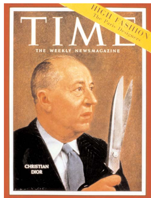
Fig. 7. En 1957 Christian Dior fue el primer modisto del mundo que tuvo el honor de aparecer en la portada del Time Magazine .

Así describe Dior, en su autobiografía, Christian Dior et moi , la casa en la que nació, hoy convertida en museo, el único museo que existe en Francia dedicado a la obra de un diseñador de moda. El color rosa de la fachada y el gris de la gravilla, grabados en su retina, fueron los colores predominantes en su casa de costura, y la huella que dejaron en su memoria el jardín, el huerto, el invernadero y las flores que cuidaba su madre fueron siempre fuente de inspiración. Granville perduró en su memoria como un paraíso terrenal y la voluntad de evocar aquella atmósfera alimentó su creatividad el resto de su vida. La silueta del New Look era un deseo de recrear la belleza de las damas de su infancia, la búsqueda del eterno femenino, y su afición a los perfumes, un intento de atrapar con el olfato, el más intangible de los sentidos, los recuerdos de aquel jardín perdido. Para Dior la nostalgia era inspiración.