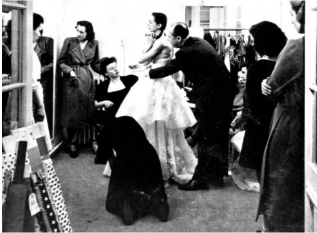
Fig. 5. Ensayo en el taller de un modelo de la primera colección de Dior. El maestro experimenta con el volumen de la tela sobre una maniquí.

Bazaar . Entusiasmada, bajando las escaleras del estudio tras el desfile, gritaba anunciando a quien quisiera oírle el deslumbrante acontecimiento: " It's a New Look ".